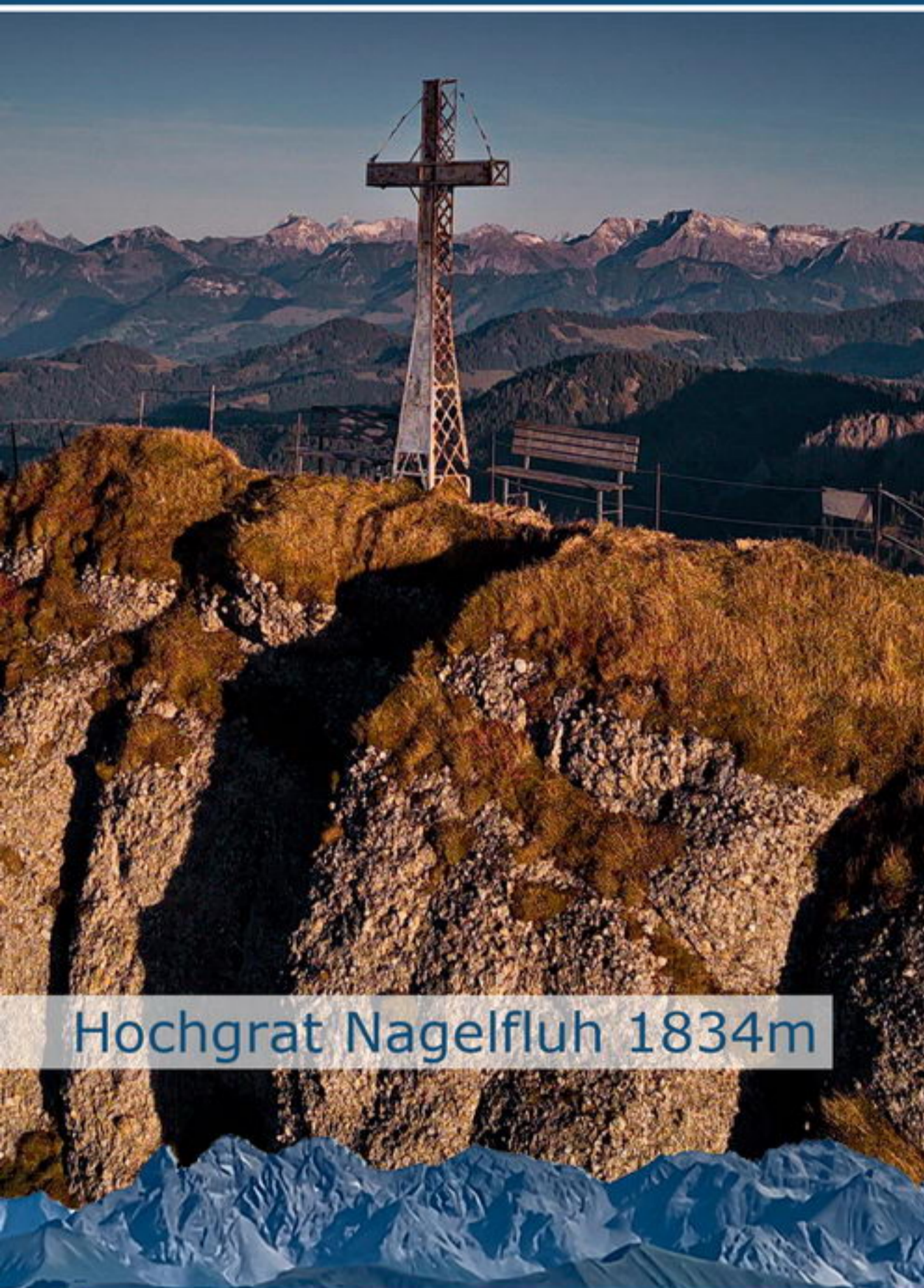
Hochgrat Nagelfluh 1834m